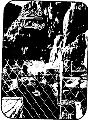
عمران سیریز میں زیر ولینڈ کے لئے عمران کا شاندار ایڈیو نیچر

روبوٹس کے ہر نیچے اڑا دیے۔ کیوں؟ عمران نے ریڈ وولف کو رگلا بنا کر اپنے حکم کی تعمیل کرنے پر مجبور کر دیا۔ کون سا حکم؟ □ آپیس باؤل میں عمران نے سپریم کمانڈر کو آپیس اسٹیشن تباہ کرنے کی دھمکی دی اور دوسرے ہی لمحے آپیس اسٹیشن کے پر نیچے اڑ گئے۔ کیسے؟